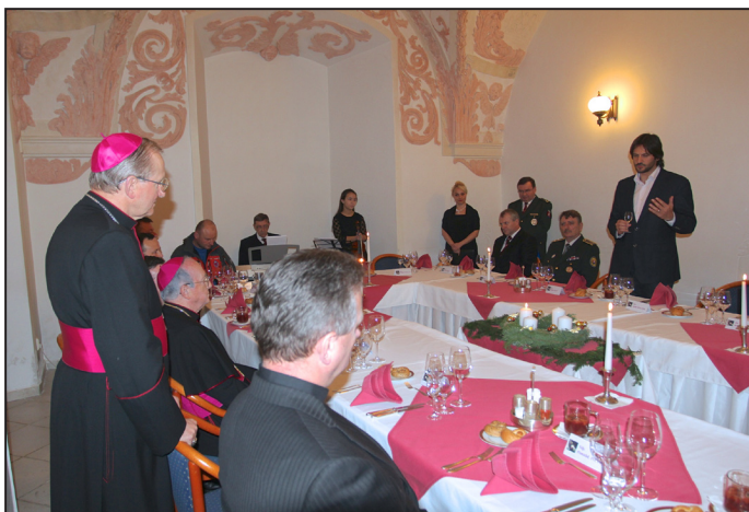
Vojenský biskup s predstaviteľmi silových zložiek štátu na adventnom večeri