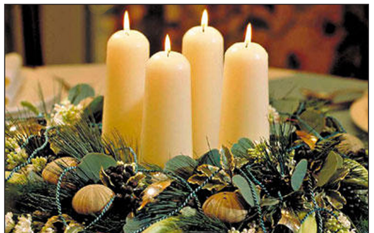
Adventné obdobie začali sláviť symbolicky aj za mrežami väznice