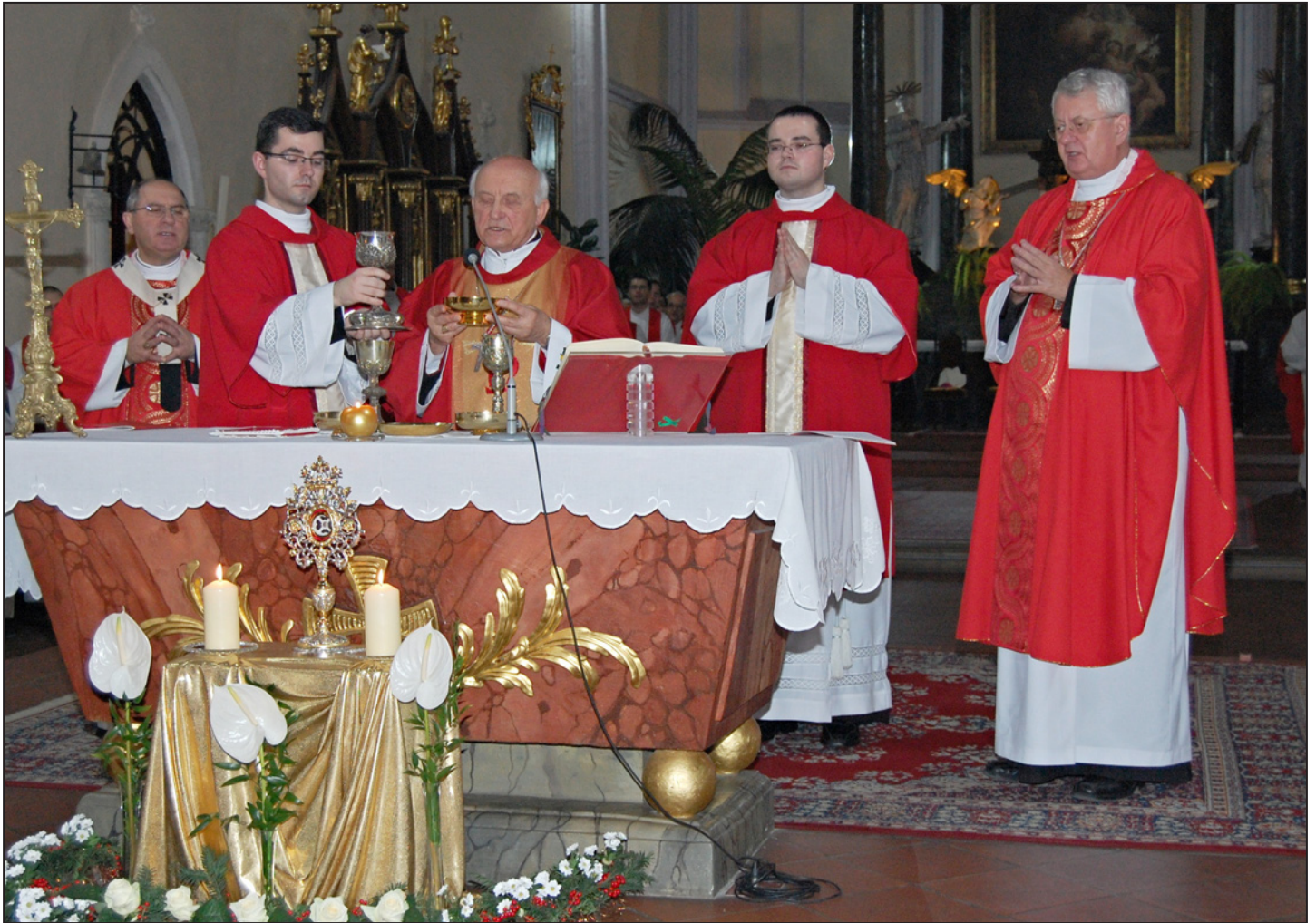
Ondrejovské dni v Košickej arcidiecéze