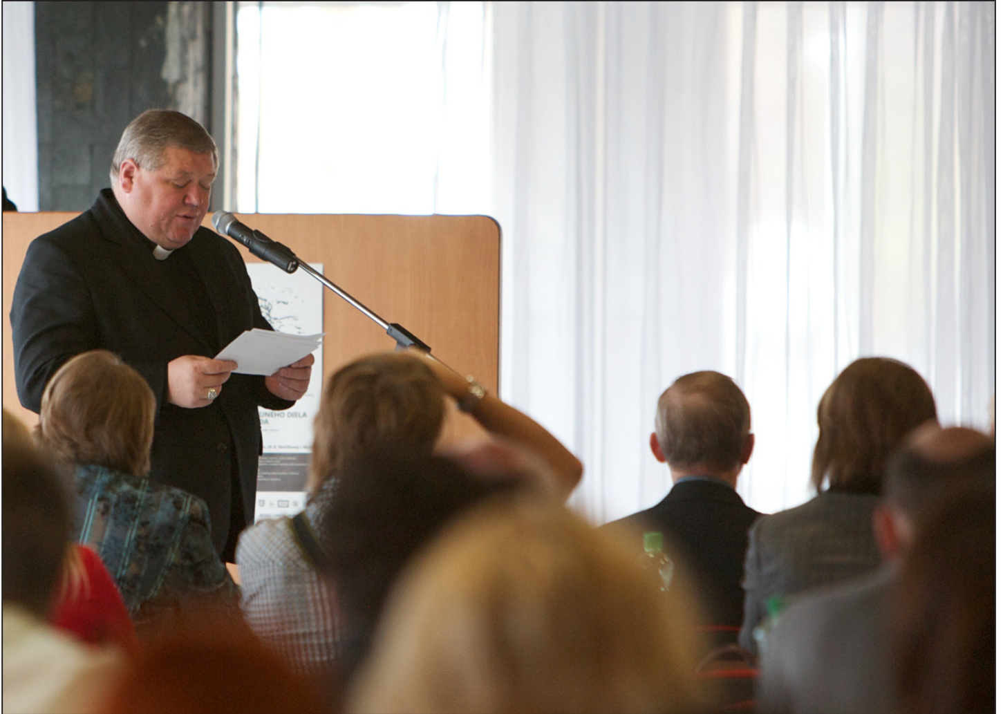
V Nitre sa konala konferencia o sv. Cyrilovi a Metodovi