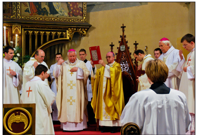
Na Spišskej Kapitule si pripomenuli patróna katedrály a diecézy