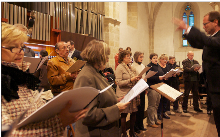
Hudba nie je iba skrášľovaním liturgických slávností